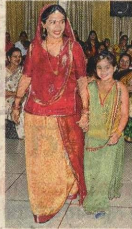
राजस्थानी लुक में मां-बेटी।