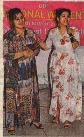
बेटी की नादानियां भरी कहानी सुनाती मां।