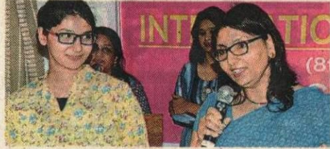
मां की तारीफों पर स्नेह की मुस्कान भरती बेटी।