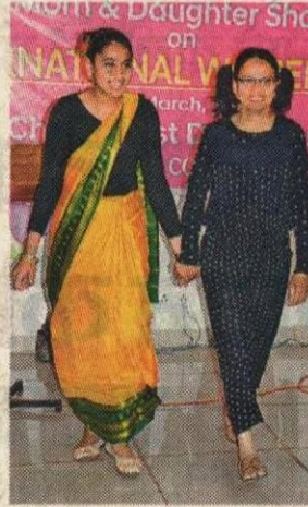
मां के रोल में बेटी और बेटी बनी मां।