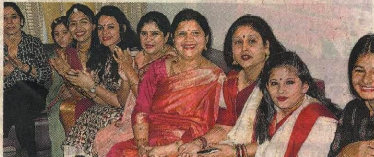
वुमंस डे पर फैकल्टी क्लब में आयोजित कार्यक्रम में लेडीज ने स्नूब किया इंजर्चों।